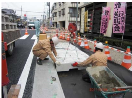
写真1 施工状況写真（据え付け）