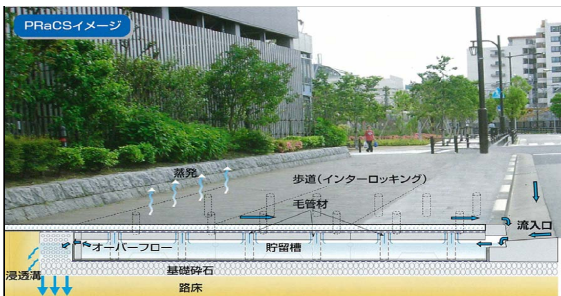
図1 プラックスの構造及び機能イメージ