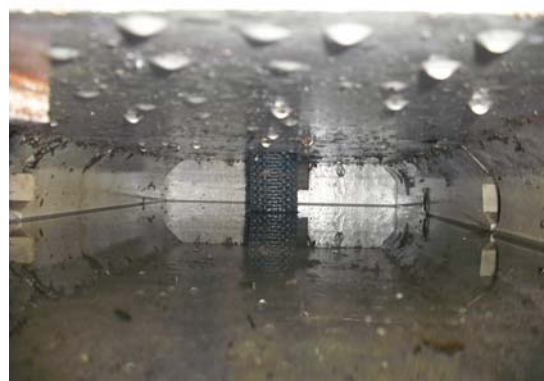
写真2 施工後の貯留槽内部