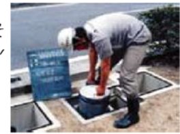
ろ材カートリッジの着脱