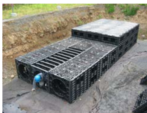
図2「ケーブル型」の概要