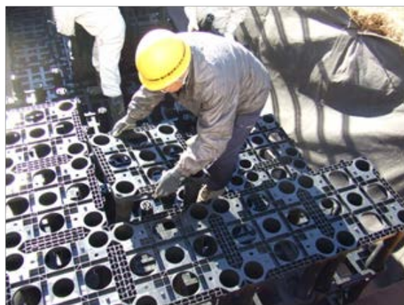
写真 2-1 組立状況