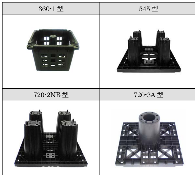
表-1.1-1 SSBB 一覧表

技術の概要 シンシンプロック槽は、熱可塑性ポリプロピレン(以下 PP と記す)を射出成形した表-1.1-1 記載の形状のブロック (シンシンプロック :以下必要に応じて SSBB と記す) とシート類を組合せ、雨水の流出抑制施設及び有効利用施設として活用する。